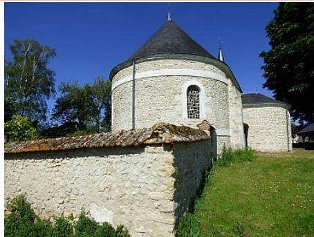
Office de Tourisme des Champs d'Amour