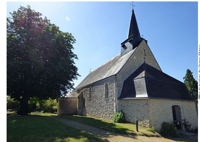
Office de tourisme des Champs d'Amour