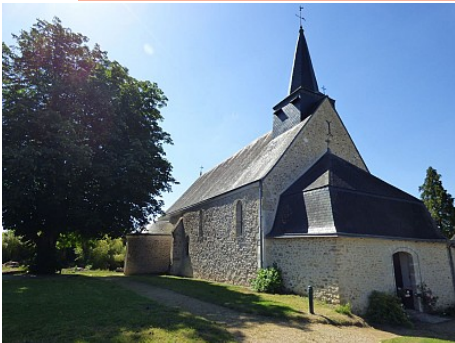
Office de Tourisme des Champs d'Amour